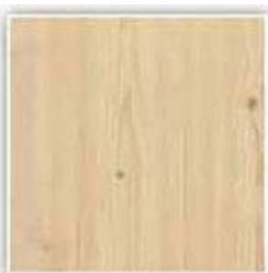
396 SMRK SUKATÝ