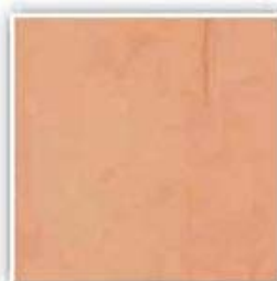
H1955 KALVADOS MERUŇKA