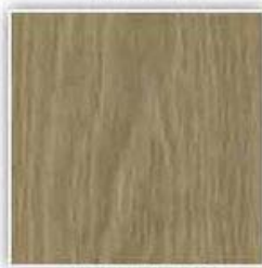
748 DUB URALSKÝ