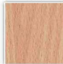
432 BUK NATUR