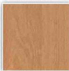
637 OLŠE IMPULS