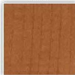
430 JAVOR TMAVÝ