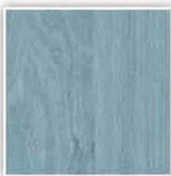
635 OLŠE MODRÁ