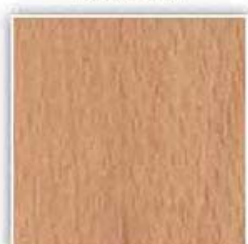
438 BUK RUSTIKAL