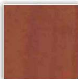
H1951 KALVADOS TMAVÝ