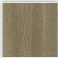
740 DUB HORSKÝ