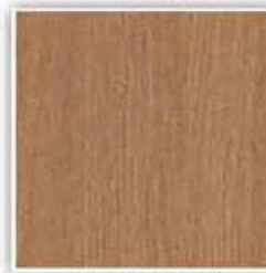
757 DUB PŘÍRODNÍ