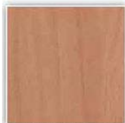
H1984 BUK TYROLSKÝ