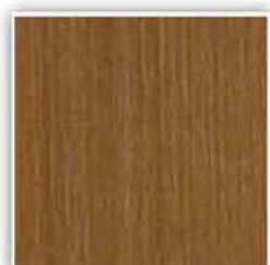
433 TEAK SIAM