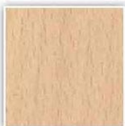
H1932 BUK TYROLSKÝ