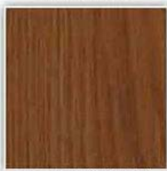
741 DUB HORSKÝ TMAVÝ