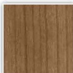
435 TREŠEŇ MORGANA