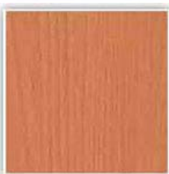
399 BUK BUCHLOV