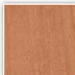
436 HRUŠEŇ SVĚTLÁ