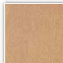
437 JAVOR KRYSTAL