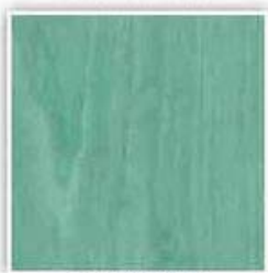
632 OLŠE ZELENÁ