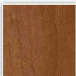
434 HRUŠEŇ TMAVÁ