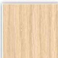
440 DUB SVĚTLÝ