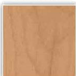
439 AL JAŠKÁ BRÍZA